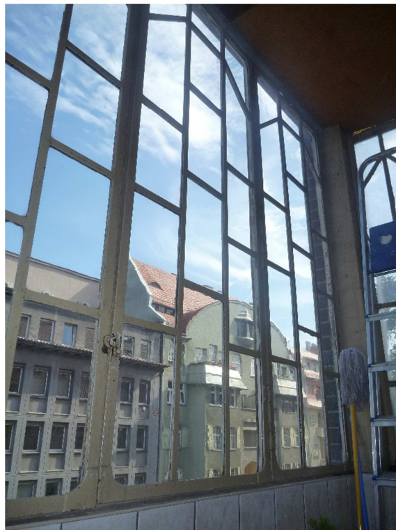
Fotografia 4 Widok od wnętrza