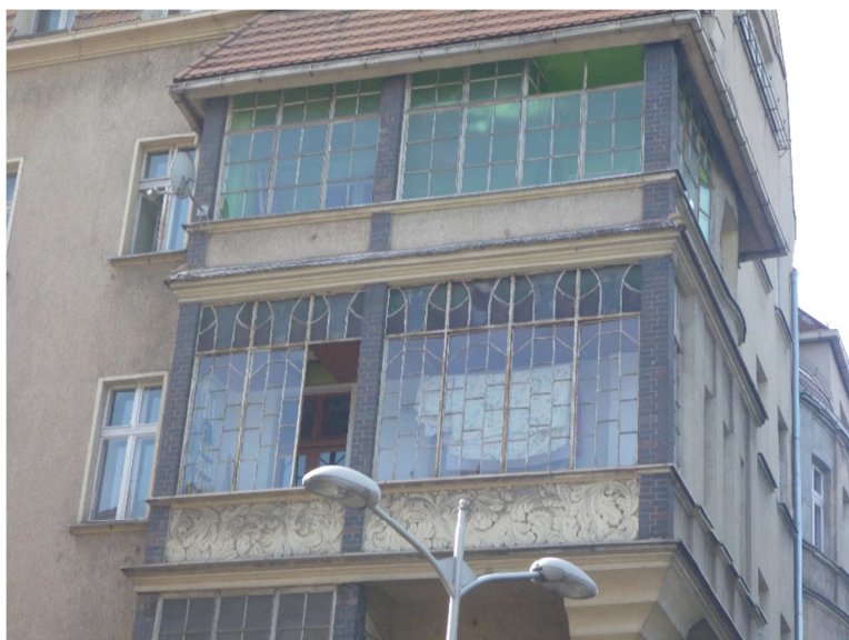
Fotografia 1 Widok od strony wschodniej