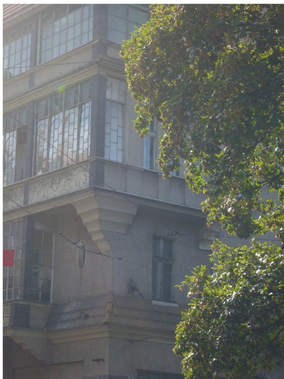
Fotografia 3 Widok od strony północnej

Wymiany zabudowy szklanej wykusza w mieszkaniu nr 6 w budynku przy ulicy Wita Stwosza 1 w Katowicach.