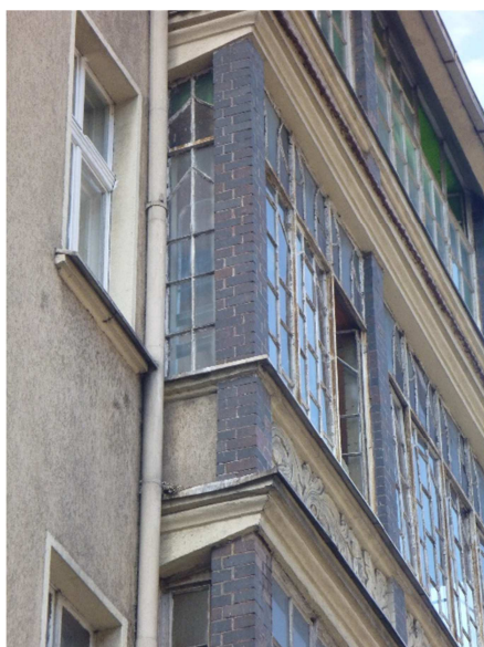
Fotografia 2 Widok od strony południowej